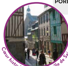
Cœur historique du centre-ville de Saint-Brieuc