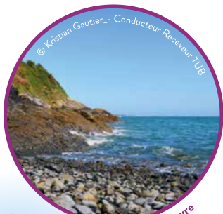
Plage du Petit Havre